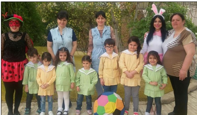
Երկուշաբթի՝ 2017 թ. ապրիլի 17-ին, Ծափնշահրի հայոց սպգային «Նարեկ» մանկապարտէզ-

նախակրթարանի տեսչութեան, ուսուցչական կազմի եւ ծնողական խորհրդի նախաձեռնութեամբ գեղեցիկ հանդիպում էր կազմակերպել դպրոցի սաների եւ բոլոր երեխաների կողմից սիրած «Զատիկի» եւ «Նապաստակի» հետ: Երախտների սիրելի բարեկամներ «Զատիկն» ու «Նապաստակը» այցելեցին դպրոցի սաներին եւ միասին զւարճալի պահեր վայելեցին: Նրանք խանդավառութեամբ միասին պարեցին եւ բալում խաղացին: Այնուհետեւ զատկական տօնի առիթով ճաշակով գունեղ հակիթներ ներկեցին, որոնց շարեցին ծնողական խորհրդի միջոցով պատրաստած զամբիղների մէջ եւ բոլորը միասին հաճոյքով ճաշակեցին օրւայ նախաճաշը: