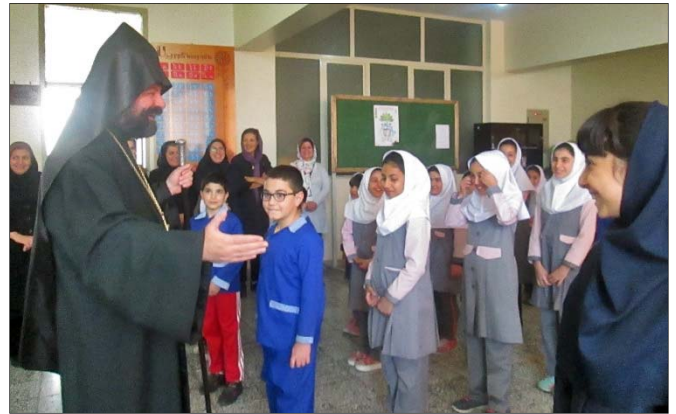
Օրուայ առիթով համեստ հիւրասիրություն էր կազմակերպել համայնքիս հայոց ազգային դպրոցներում Ծնողական խորհուրդների նախաձեռնութեամբ:

սարան առ դասարան հանդիպելու աշակերտներին՝ աւելի մօտիկից ծանօթանալու կրթական միջավայրին: Ստեղծած այս ջերմ մթնոլորտում դպրոցի աշակերտները գեղեցիկ արտայայտություններով եւ ասմունքներով ներկայացան՝ արժանանալով ներկաների խրախուսանքներին: