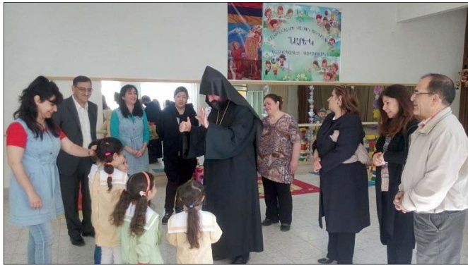
Ապա գերայ. Հայր Սուրբը ցանկություն յայտնեց դա-

լով աշակերտությանը՝ յորդորեց նրանց միշտ քաջ գիտակցելով իրենց սրբազան պարտականությունը հայեցի եւ քրիստոնէավայել դաստիարակելու ուղղութեամբ, բարձր պահեն գիտութեան եւ լուսաւորութեան ջանքը եւ հաստատակամ քայլեն դէպի վառ ու լուսաւոր ապագայ: Նա բարձր գնահատեց նաեւ դպրոցի պատասխանատուների վեհ առաքելությունը, որոնք որեւէ ճիգ ու ջանք չեն խնայում հայոց ազգային դպրոցները շէն ու կանգուն պահելու նւիրական գործում: