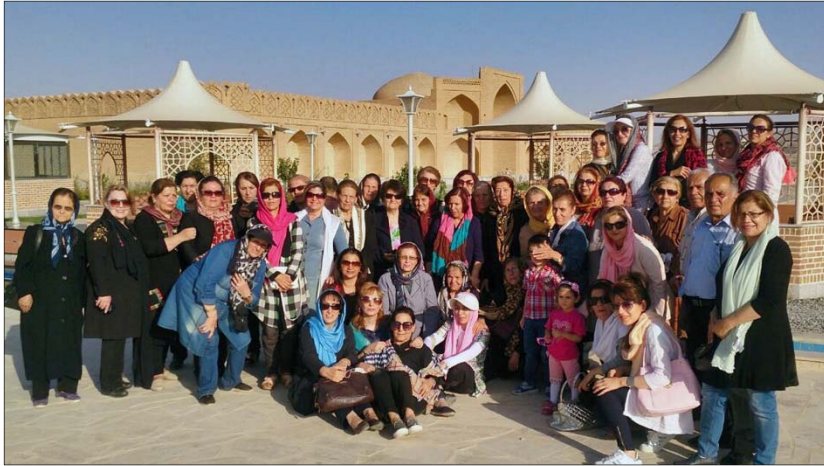
Երեցական միաւորի ղեկավարութեամբ, երկուշաբթի՝ 2016 թականի սեպտեմբերի 26-ի յետմիջօրէի ժամը 15:30-ին 51 հոգանոց

Ն.Ջ. Հայ Մ.Մ. «Արարատ» միութեան Շահինջահրի մասնաճիղի վարչութեան հովանաւորութեամբ եւ Երեցական միաւորի նախաձեռնութեամբ, կազմակերպել էր շրջագայութիւն դէպի «Քարանասարայէ Արասի»: