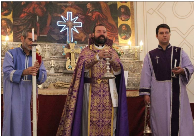
Գերպ. Հայր Սուրբը հաւատացեալներին յորդորեց,

Յընթացս Պատարագի գերպ. Հայր Սուրբը հաւատացեալներին փոխանցեց Նոր Զուղայում իր անդրանիկ քարոզը: Նա սկզբում անդրադարձաւ Ս. Գէորգ զօրավարի կեանքին ու գործունէութեանը եւ յանուն հաւատի նրա կատարած սխրագործութեանը, ինչի շնորհիւ էլ դասել է սրբերի շարքին: Այնուհետեւ քարոզիչն անդրադառնալով, որ դարերի ընթացքում Ս. Գէորգ զօրավարի արժէքն ու նշանակութիւնը առաւել է պայծառացել եւ մեծացել եւ այսօր սուրբը մեծ արժէք ու նշանակութիւն ունի քրիստոնէայ ժողովուրդների մօտ, աւելացրեց. «Մեր ժողովուրդը ամէն տարի այս օրը գնում է Աստուծո սուրբ տունը եւ իր աղօթքները փոխանցում Ս. Գէորգ զօրավարին: ...Յուսամ, որ բոլոր հաւատացեալներն իրենց աղօթքների պատասխանն ստանան՝ սրբի բարեխօսութեամբ եւ իրենց հաւատքով»: