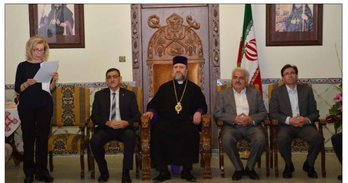
Սկզբում արտայայտեց Կրթական խորհրդի ատե-

կով, Կրթական խորհուրդը ձեռնամուխ եղաւ չորեքշաբթի՝ մայիսի 11-ի երեկոյեան, Ս. Ամենափրկչեան վանքի Ծաղկեայ դահլիճում կազմակերպել գնահատման երեկոյ, որին մասնակցում էին՝ Սպահանի հայոց թեմի առաջնորդ գերշ. Տ. Բարբէն արք. Չարեանը, ազգային մարմինների ներկայացուցիչներ, օլիմպիադային մասնակից խմբի ղեկավար ուսուցիչները, աշակերտուհիներն ու նրանց ծնողները, խմբի նախապատրաստական դասընթացների կազմակերպման գործում դերակատար ուսուցիչներն ու անհատները եւ Նոր Զուղայի հայոց դպրոցների ներկայացուցիչներ: