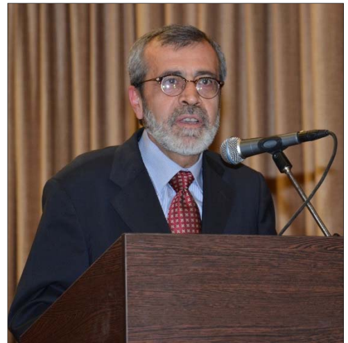
Օրւայ գեղարուեստական բաժինն