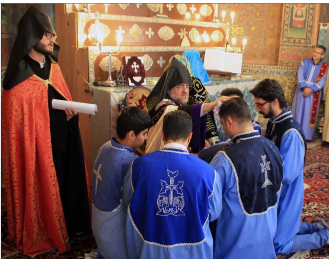
Արարողութեանը ներկայ էին նաեւ հիւրաբար Նոր

Զուղայում գտնուող գերշ. Տ. Վարուժան արք. Հերկէլեանը, քահանայից եւ դպրաց դասերը, Սպահանի Հայոց Թեմի Կրօնական Խորհրդի, Ն.Զ. Հայոց Եկեղեցեաց Վարչութեան անդամները եւ հաւատացեալ ժողովուրդ: Ս. Պատարագի երգեցողութիւնը կատարում էր Ս. Ամենափրկչեան վանքի «Կոմիտաս» երգչախումբը: