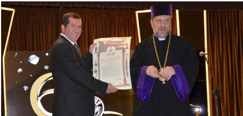
Յաջորդիւ Սպահանի Հայոց Թեմի առաջնորդ գերշ. Տ. Բարգէն

Շնորհաւորական ուղերձ էին յղել նաեւ Թեհրանի եւ Ատրպատականի Հայոց Թեմերի հոգեւոր առաջնորդները, Շահինշահրի հոգեւոր տեսուչը, իսկ. խորհրդանարում զոյգ պատգամաւորները, Հայ դատի շրջանիս յանձնախմբը, «Ալիք» օրաթերթի տնօրինութիւնը եւ խմբագրական կազմը, միութեանս արտօնատէր Թաթուլ Օհանեանը Թեհրա-