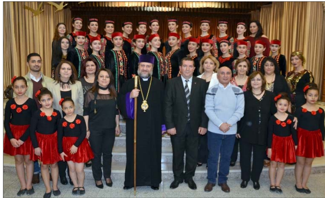
Նշելի է, որ իրականացւած համերգը մեծ հետաքրքրութեամբ ընդունեց սրահում լեւի-լեցուն հանդիսատեսի կողմից:

Սրբազան հայրն իր արտայայտութիւնների աւարտին իր ուրախութիւնը եւ հպարտութիւնը յայտնեց կազմակերպւած բազմաթիւ ձեռնարկների արդիւնքում համայնքում տիրող աշխուժութեան եւ կենսունակութեան կապակցութեամբ: