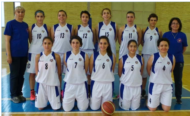
Մրցաշարին, որ կայացաւ «Արարատ» միութեան

2015 թւականի նոյեմբերի 4-ից 6-ը, Նոր Զուղայի Հայ Մ.Մ. «Արարատ» միութեան մարզասրահում տեղի ունեցան կանանց բասկետբոլի երկրի ակումբային Ա կարգի լիգայի առաջին շրջանի մրցութիւնները: